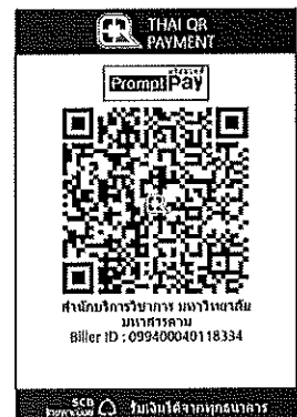
สแกนชำระค่าลงทะเบียน

หมายเหตุ : คอมพิวเตอร์ ๑ เครื่อง / ๑ ท่าน ขอสงวนสิทธิ์สำหรับผู้ชำระค่าลงทะเบียน