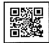
สแกนสมัครอบรม

ช่องทางการส่งใบสมัคร: สำนักบริการวิชาการ มหาวิทยาลัยมหาสารคาม