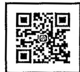
สแกนสมัครอบรม