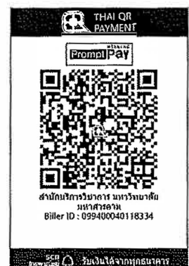
สแกนชำระค่าลงทะเบียน

ช่องทางการส่งใบสมัคร: สำนักบริการวิชาการ มหาวิทยาลัยมหาสารคาม โทรศัพท์ ๐๖๕-๓๔๗๙๓๓๘/๐๖๕-๒๕๐๑๒๙๗/๐๙๕-๐๒๐๔๕๓๐/๐๙๘-๑๐๕๖๔๗๕ หรือ ID Line : @msu60 (ต้องใส่ @ นำหน้าด้วย) โทรสาร ๐๔๒-๑๑๑๗-๐๙ หรือ E-mail: uni.msu2560@gmail.com สามารถสมัครออนไลน์ ได้ที่ http://www.local-training.com