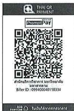
สแกน QR Code เพื่อชำระค่าลงทะเบียน

๑๔.๒ “สแกน QR Code” ผ่านทางแอปพลิเคชัน Mobile Banking