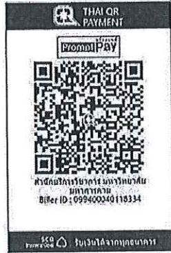
สแกน QR Code เพื่อชำระค่าลงทะเบียน

๔.๒ “สแกน QR Code” ผ่านทางแอปพลิเคชัน Mobile Banking