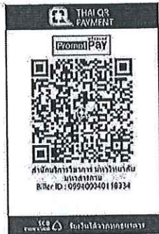
สแกน QR Code เพื่อชำระค่าลงทะเบียน

๑๔.๒ “สแกน QR Code” ผ่านทางแอปพลิเคชัน Mobile Banking