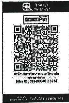
สแกน QR Code เพื่อชำระค่าลงทะเบียน.

๑๔.๒ “สแกน QR Code” ผ่านทางแอปพลิเคชัน Mobile Banking