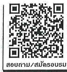
สอบถาม/สมัครอบรม