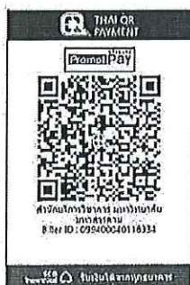
แท่น QR Code เพื่อชำระค่าลงทะเบียน

๑๔.๒ “สแกน QR Code” ผ่านทางแอปพลิเคชัน Mobile Banking