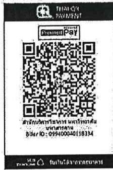
สแกน QR Code เพื่อชำระค่าลงทะเบียน.

๑๔.๒ “สแกน QR Code” ผ่านทางแอปพลิเคชัน Mobile Banking