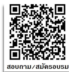
สอบถาม/สมัครอบรม