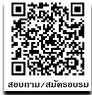
สอบถาม/สมัครอบรม