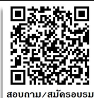
สอบถาม/สมัครอบรม