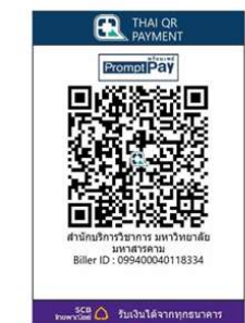
สแกน QR Code เพื่อชำระค่าลงทะเบียน